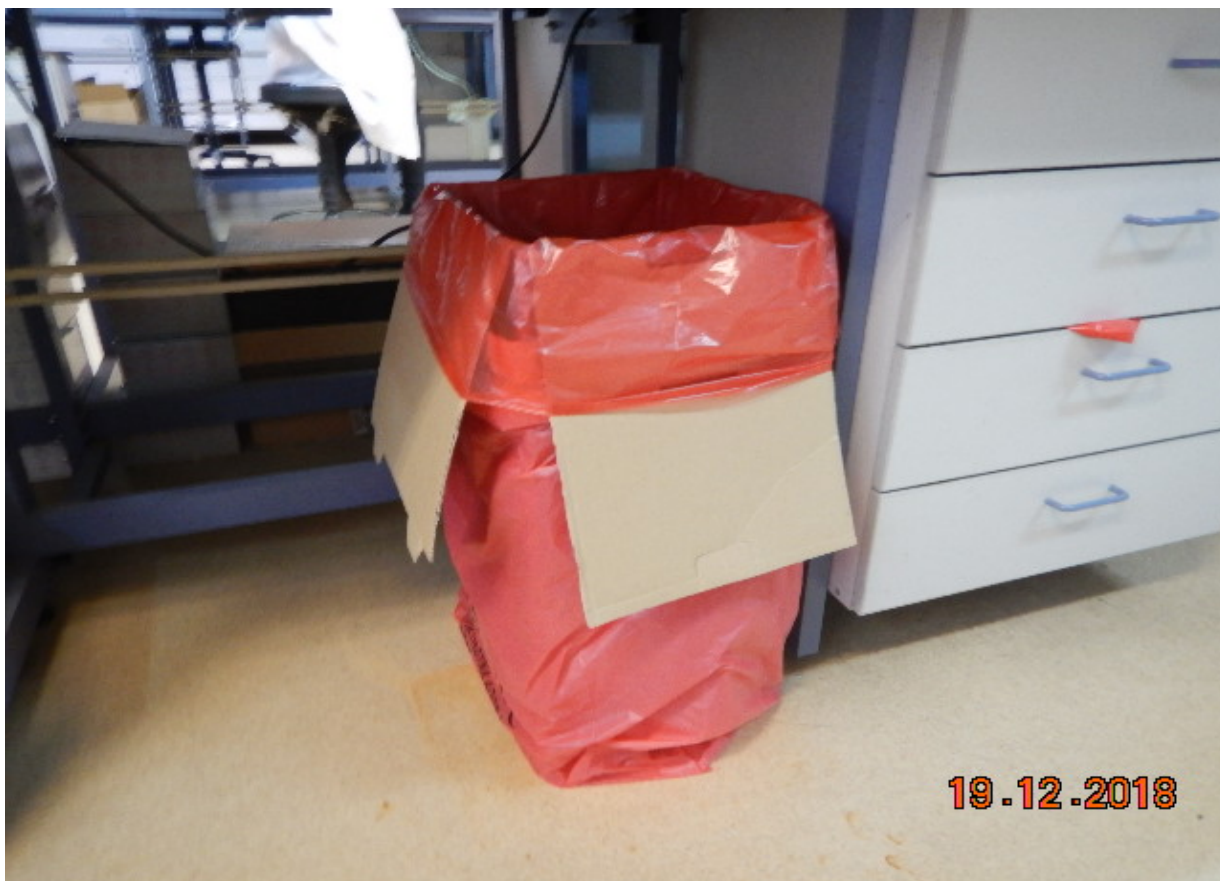
Κάδος με σακούλα κόκκινου χρώματος για τα ΕΑΑΜ ή τα ΜΕΑ προς αποτέφρωση