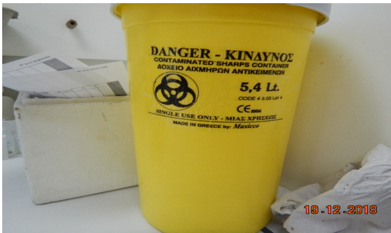
Ειδικός περιέκτης για αποθήκευση αιχμηρών αντικειμένων