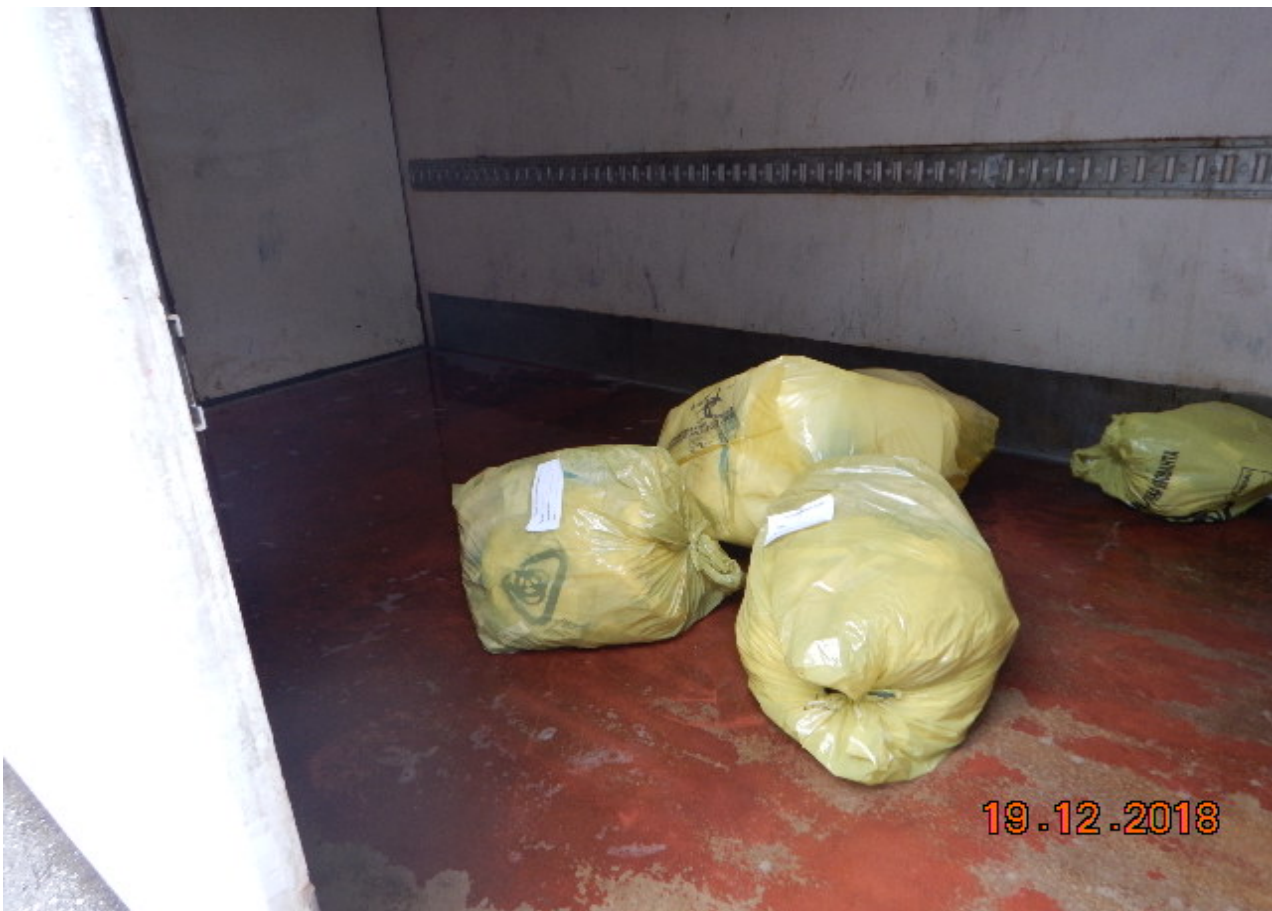
Ειδικός ψυκτικός θάλαμος για την προσωρινή αποθήκευση ΕΑΑΜ πριν την παράδοση τους σε ειδική εταιρεία διαχείρισης επικινδύνων ιατρικών αποβλήτων προς αποστείρωση.