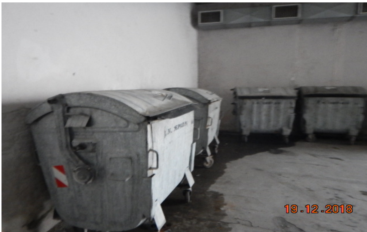
Κάδοι προσωρινής αποθήκευσης στερεών αποβλήτων αστικού τύπου εντός στεγασμένου χώρου.