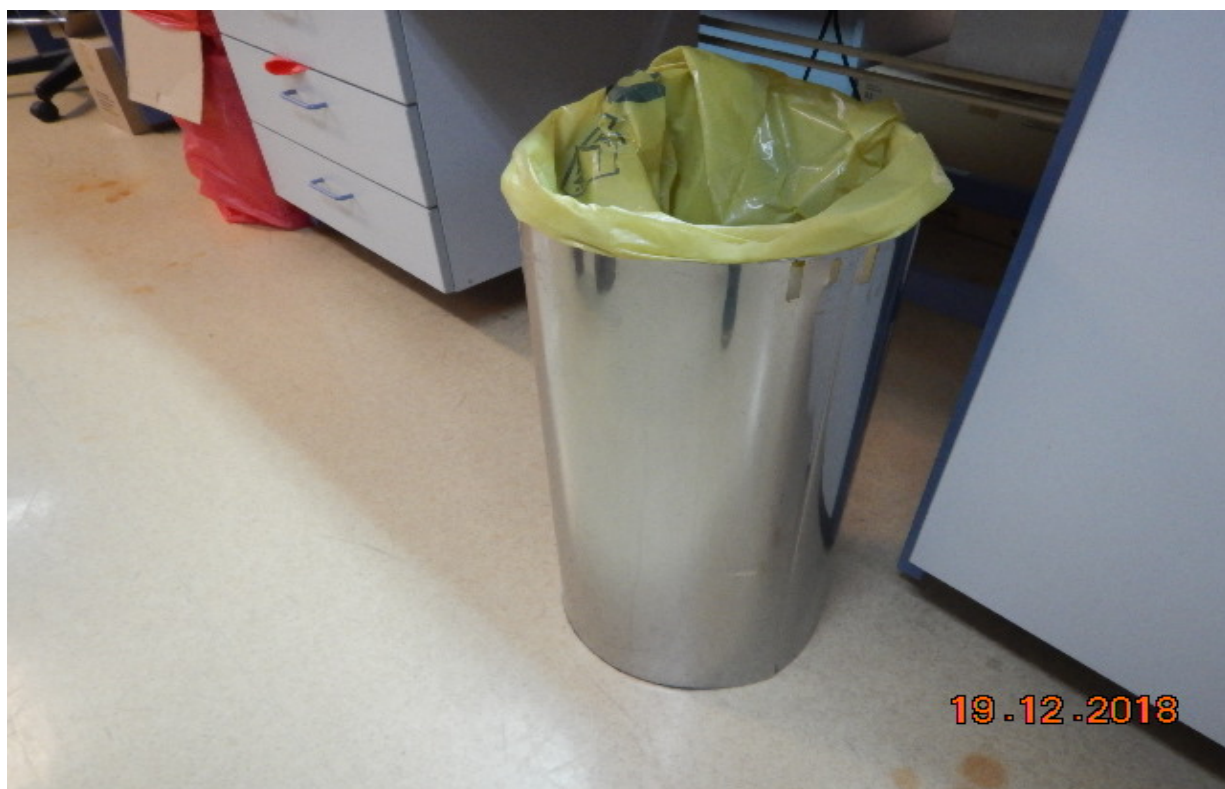
Κάδος με σακούλα κίτρινου χρώματος για τα ΕΑΑΜ προς αποστείρωση.