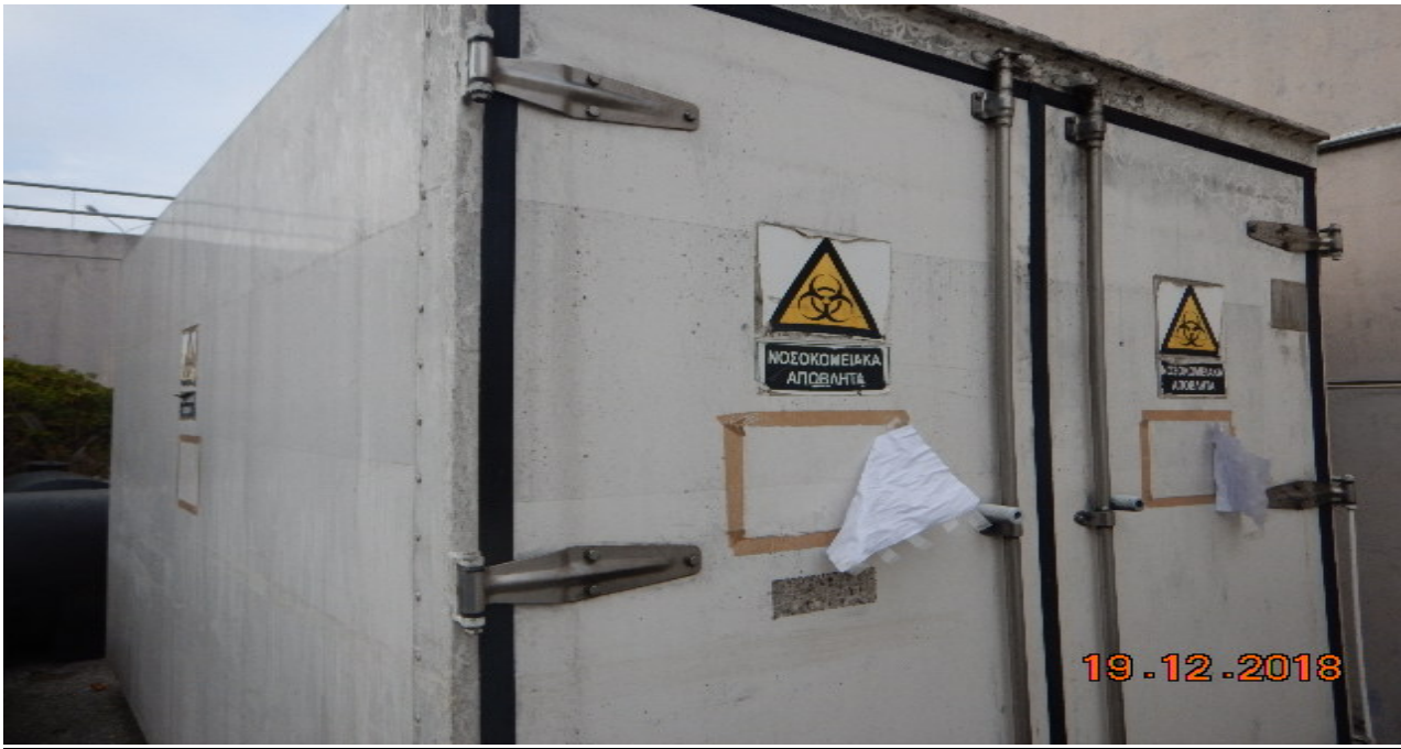
Ειδικός ψυκτικός θάλαμος για την προσωρινή αποθήκευση ΕΙΑ πριν την παράδοση τους σε ειδική εταιρεία διαχείρισης επικινδύνων ιατρικών αποβλήτων.