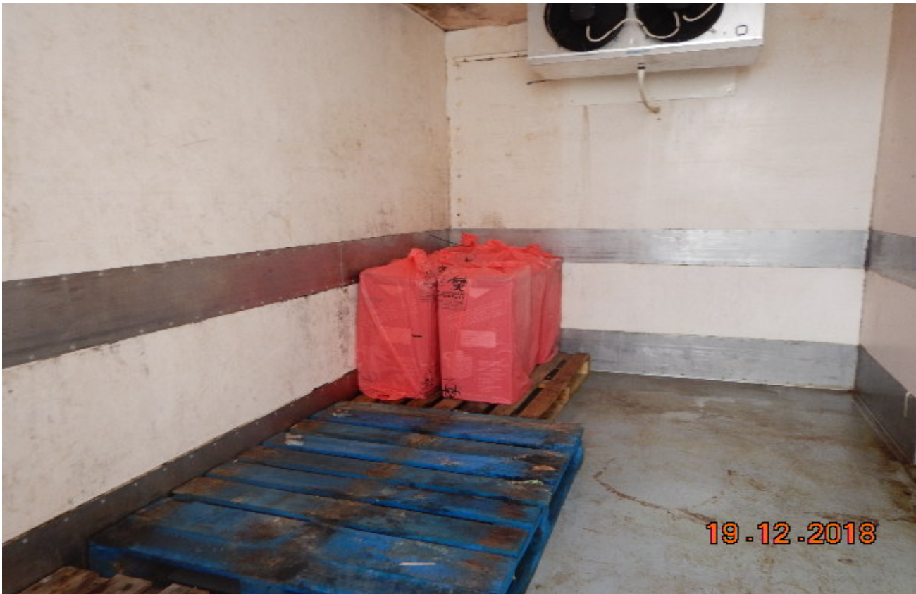
Ειδικός ψυκτικός θάλαμος για την προσωρινή αποθήκευση ΜΕΑ πριν την παράδοση τους σε ειδική εταιρεία διαχείρισης επικινδύνων ιατρικών αποβλήτων προς αποτέφρωση.